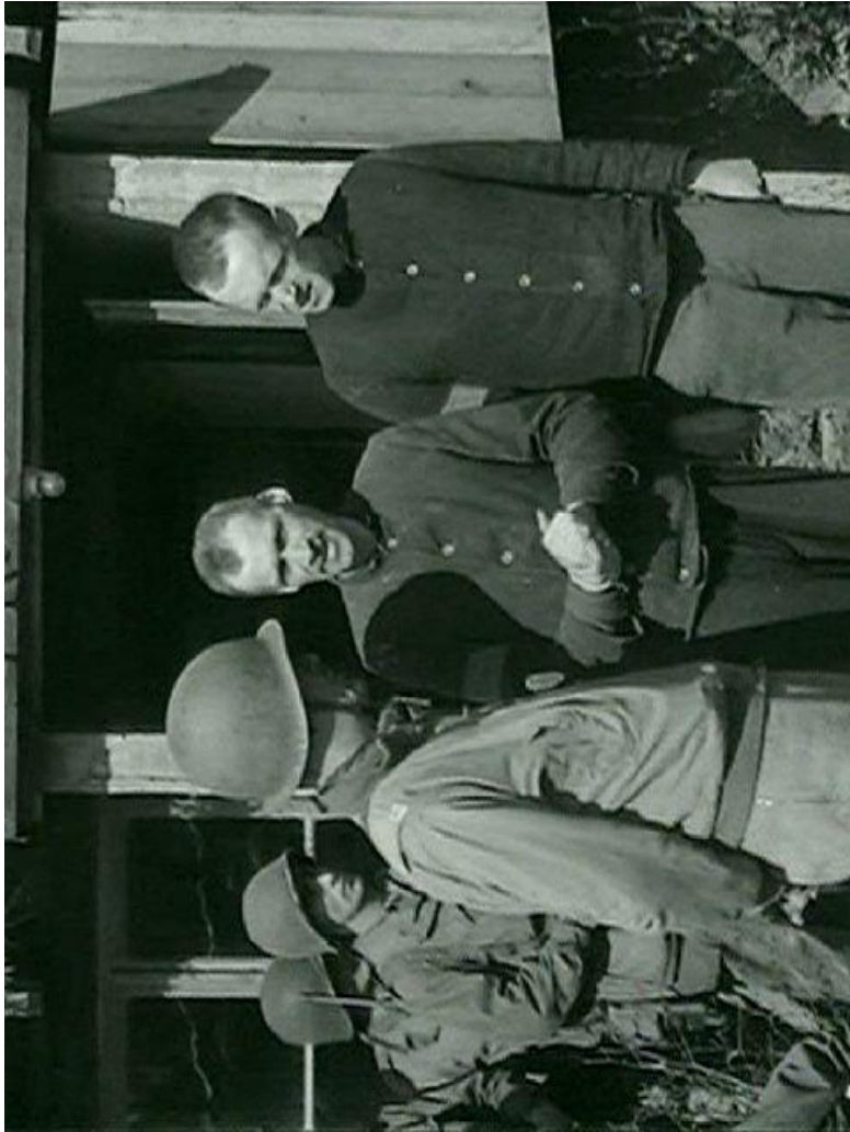
Bij opdracht 1