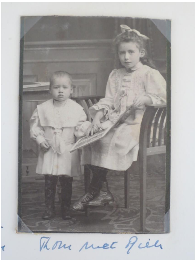
Bij opdracht 1