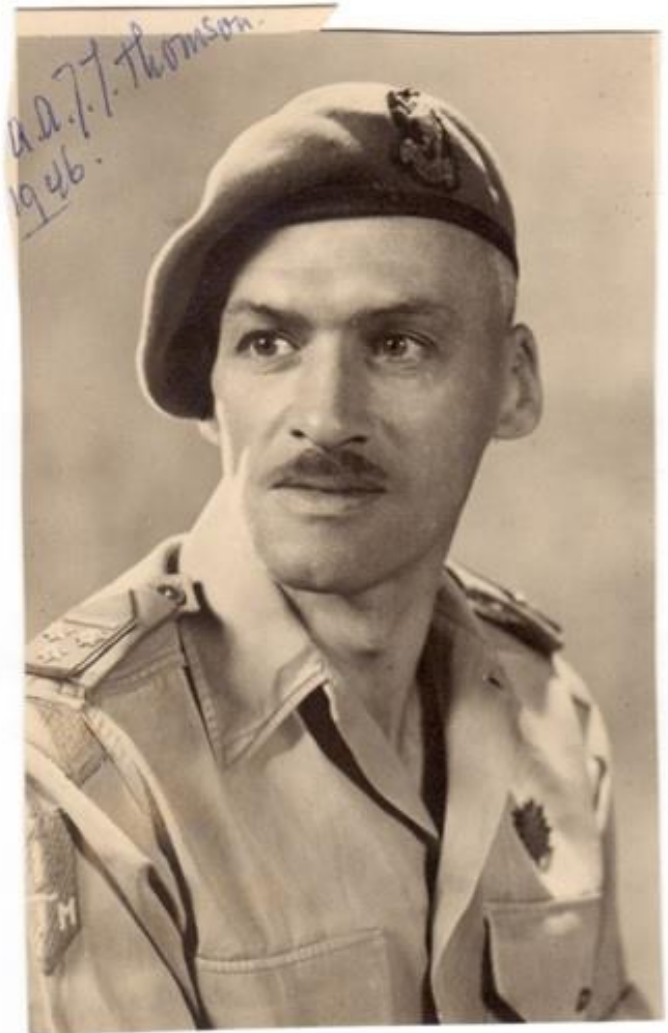
Bij opdracht 1 Bron: Privé-collectie Else Kooijman-Thomson Overgedragen aan het NIOD