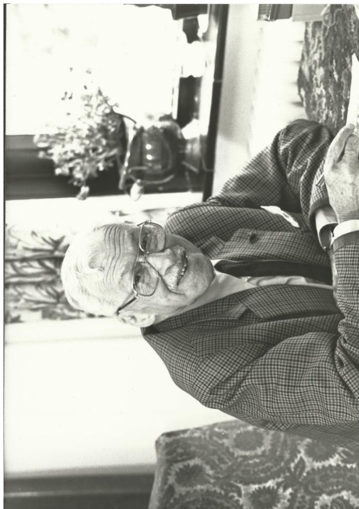
Bij opdracht 1