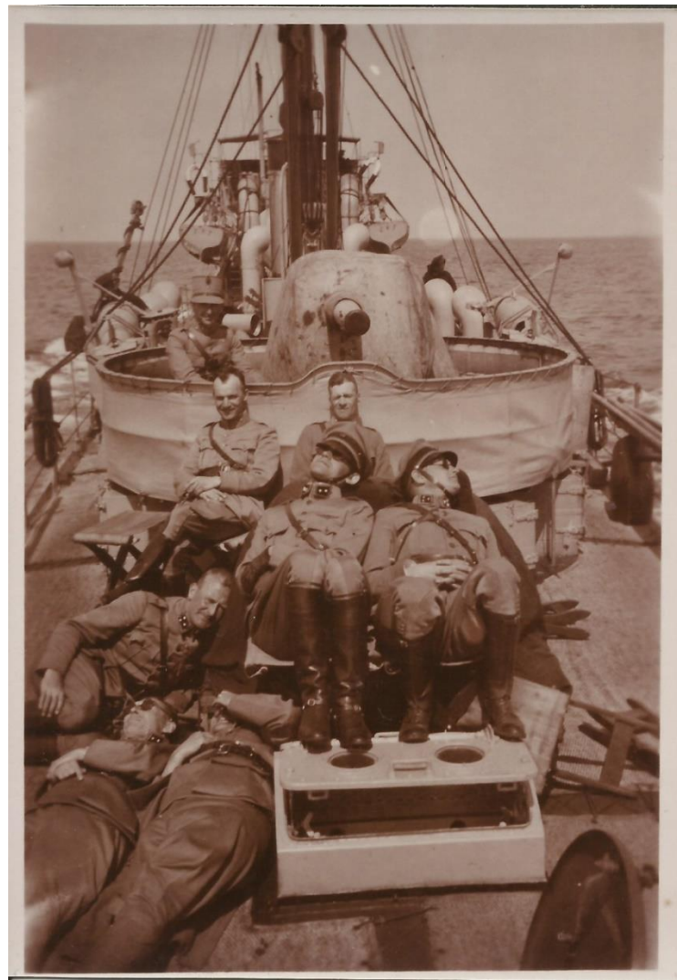
Bij opdracht 1