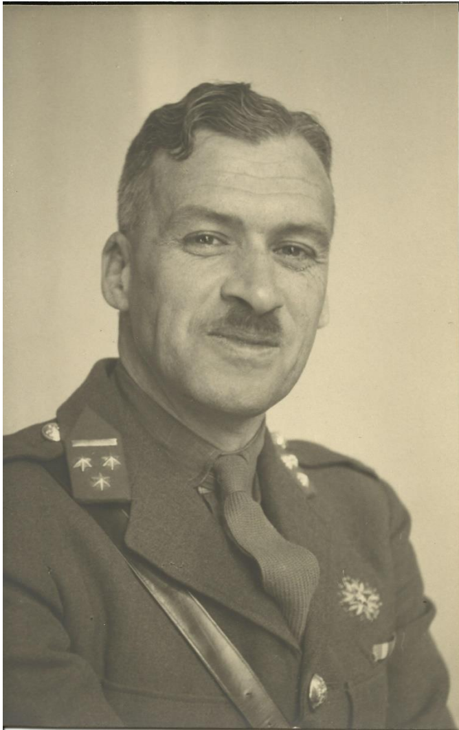
Bij opdracht 1 Bron: Privé-collectie Else Kooijman-Thomson Overgedragen aan het NIOD