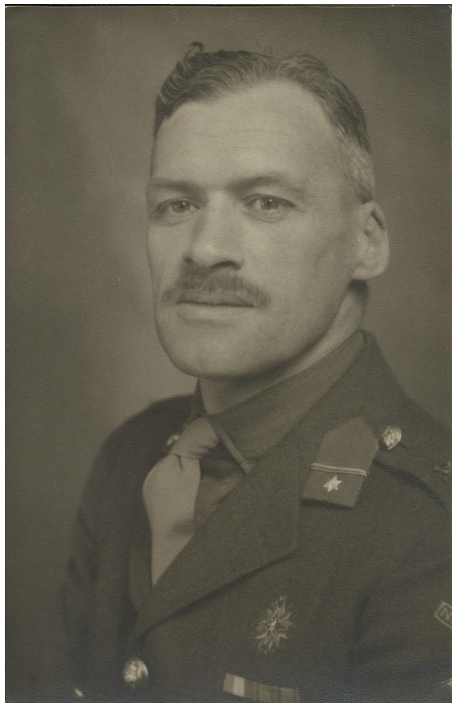
Bij opdracht 1