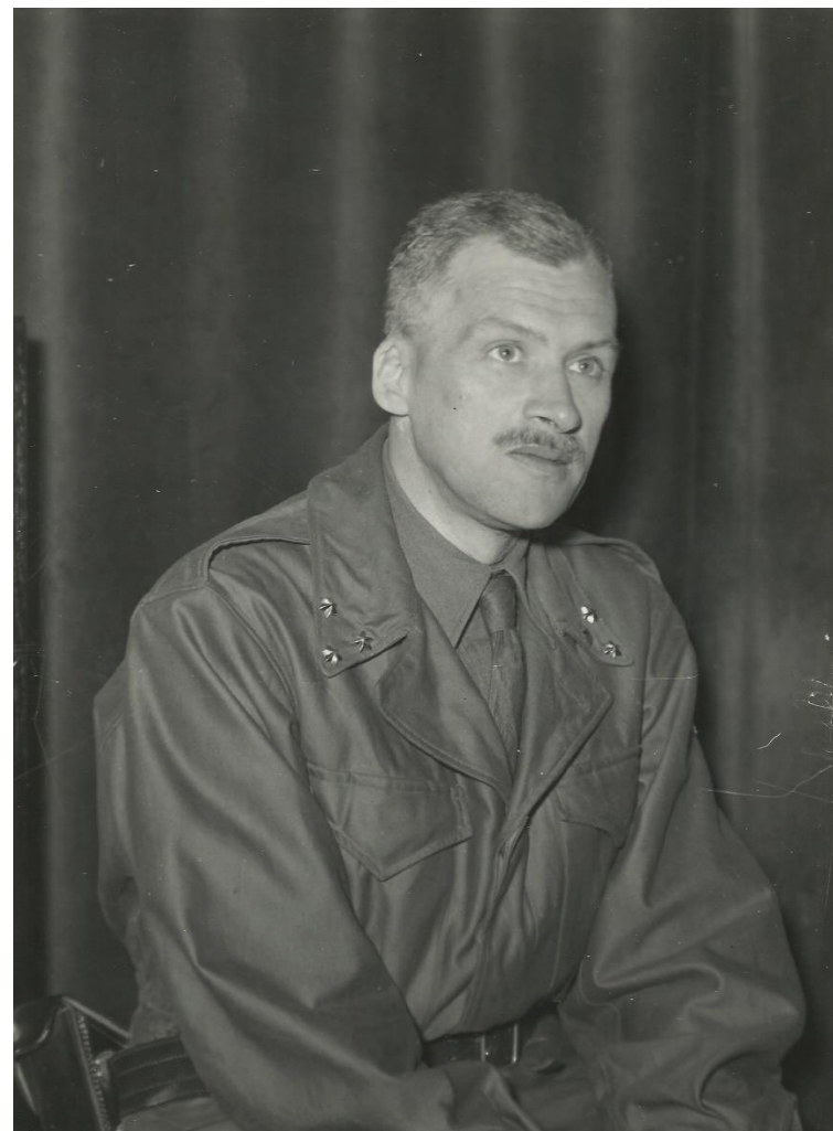
Bij opdracht 1