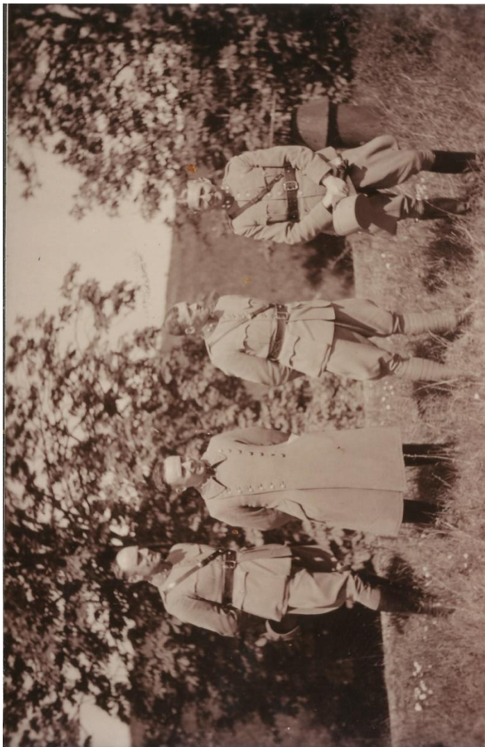
Bij opdracht 1