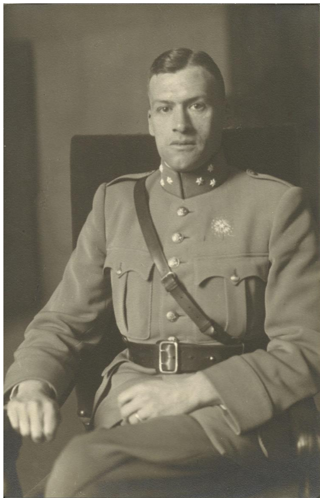
Bij opdracht 1