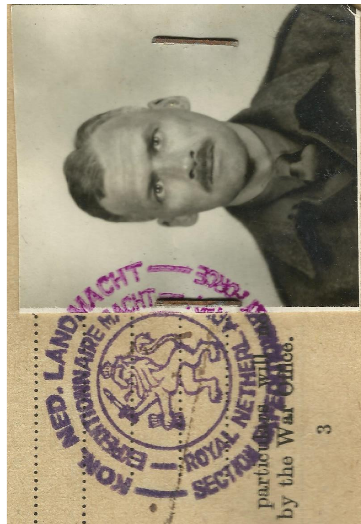
Bij opdracht 1